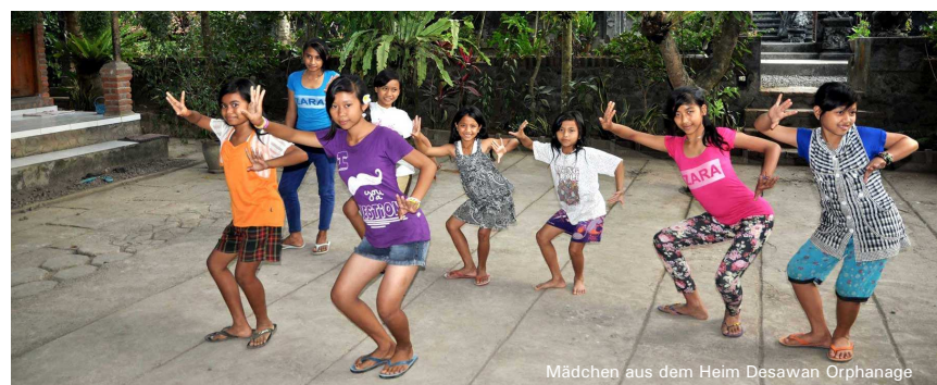
Mädchen aus dem Heim Desawan Orphanage