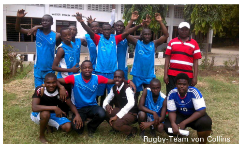
Rugby-Team von Collins

Wir freuen uns, dass wir neue Kinder unterstützen können und sie auf ihrem Weg in die Zukunft begleiten dürfen.