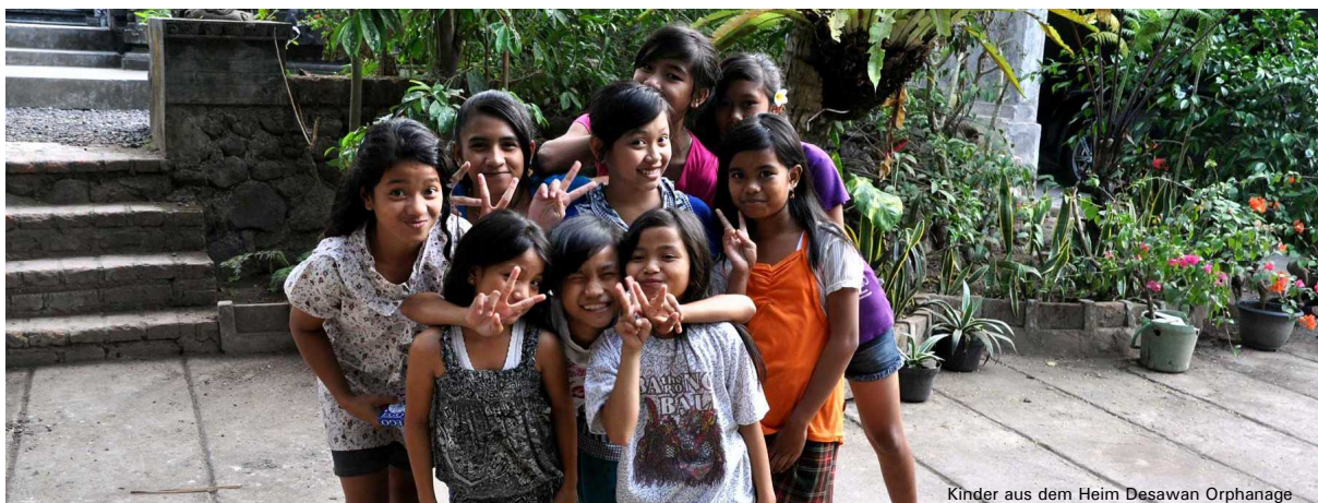
Kinder aus dem Heim Desawan Orphanage

Es freut uns, wenn Sie uns auf unserer Website oder auf Facebook besuchen. Wir berichten dort fortlaufend aus unseren Projekten.